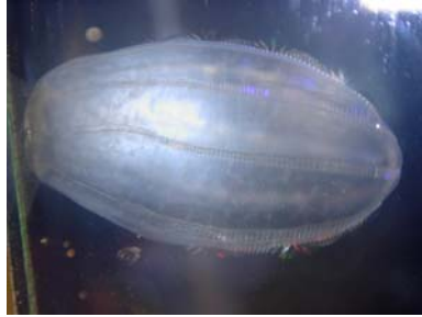
Figur 4. Melongoplen Beroe cucumis . Det viste eksemplar, der blev fanget i Kerteminde Bugt den 16. marts, er 5 cm lang.