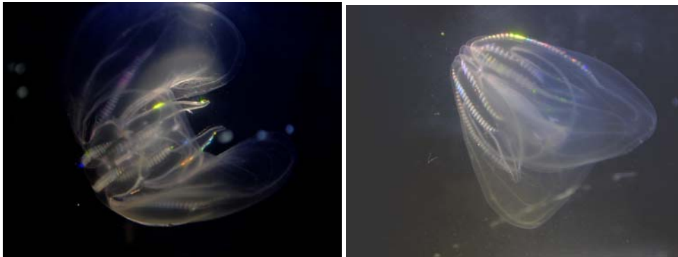
Figur 5. Ribbegoplen Mnemiopsis leidyi har (endnu) ikke noget dansk navn. Højden af de viste eksemplarer er ca. 2 cm.