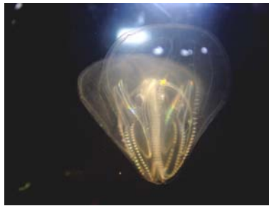
Figur 1. Ribbegoplen Mnemiopsis leidyi , fanget i Kerteminde Bugt den 16. marts 2007.

Fra Holland har ribbegoplen bredt sig i den sydlige del af Nordsøen og videre op i Skagerrak og Kattegat. I efteråret 2006 blev Mnemiopsis -ribbegoplen observeret langs den svenske vestkyst. I slutningen af februar 2007 blev den observeret i Lillebælt (Kathe Jensen & Ole Tendal, Zoologisk Museum, København, personlig oplysning.), og den 16. marts 2007 blev den 2-3 cm ægformede ribbegople registreret af Marinbiologisk Forskningscenter i indkommende vand fra Storebælt til Kerteminde Fjord (se fig. 1, 3 & 5). I de følgende måneder er ribbegoplen jævnlige blevet registreret i indløbet til Kerteminde havn, idet gennemsnitsstørrelsen har været stigende, (foreløbig) op til 7-8 cm i midten af juni (se fig. 6). I de sidste 20-25 år er gennemsnitstemperaturen i havet omkring Fyn steget omkring 2 grader, og det er i biologisk sammenhæng meget. Måske er vandet nu varmt nok til at Mnemiopsis -ribbegoplen kan etablere sig med mange individer og med deraf følgende masseforekomst og skader på fiskeriet. Det er dog også muligt, at det ikke går så galt, fordi ribbegoplernes naturlige fjende nummer ét, nemlig melongoplen, Beroe cucumis , allerede findes i vores farvande.