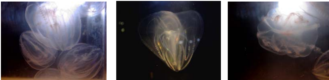
Figur 3. Mnemiopsis leidyi fanget i Kerteminde Bugt den 16. marts 2007. De viste eksemplarer er ret små, 2-3 cm i diameter.